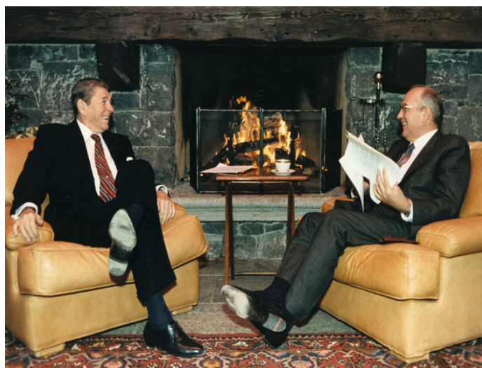
R.Reagan s M. S. Gorbačovom na Malte v r. 1985.

Dnes už máme širokú paletu informácií o pozadí týchto spoločenských pohybov v celom bývalom východnom bloku. Začiatok konca dovtedajšej bipolarity sveta sa právom prisudzuje dohodám amerického prezidenta Ronalda Reagana s prvým sovietskym prezidentom Michailom S. Gorbačovom v r. 1985. Nasledovali roky rozpadu a chaosu v medzinárodných vzťahoch štátov Rady vzájomnej hospodárskej pomoci – RVHP a Varšavskej zmluvy.