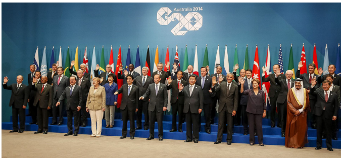
Výrečný pohľad na hlavy štátov G 20 v záverečný deň summitu 2014 v Austrálii

K najvýznamnejším opatreniam parí dohoda o prijatí účinnejších opatrení voči daňovým únikom a adekvátnu reguláciu finančných trhov . Mohlo by to konečne viesť k obmedzeniu mnohomiliardových únikov jednotlivých zbohatlíkov i oligarchických skupín bez ohľadu na štátnu, či národnú príslušnosť v daňových rajoch. Bude to však beh na ešte dlhé trate. Lebo ich finančné bohatstvo a vplyv na štátne inštitúcie i medzinárodné organizácie je, bez masového odporu a ochoty ich samotných, veľmi ťažko prekonateľný.